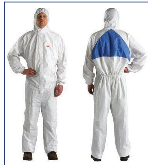
3M™ Prenda de protección 4540+ Tamaño: M/L/XL/XXL/XXXL/XXXXL