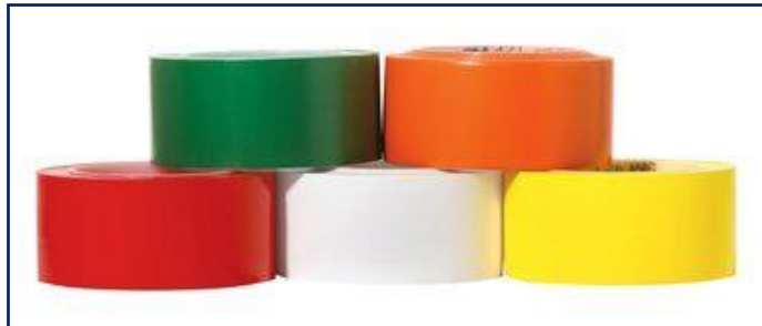
MARCACIÓN E IDENTIFICACIÓN CINTA 471 COLORES: AZUL, AMARILLO, BLANCO Y ROJO PVP: 33m x 50mm: 36,56 € / UN