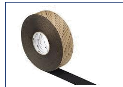
3M™ SAFETY WALK Antideslizantes de alta agresividad negra PVP: 18m x 50mm: 74,32 € / UN