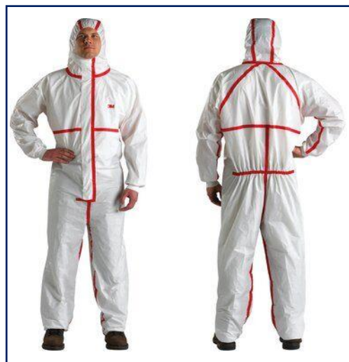
3M™ Prenda de protección 4565 Tamaño: M/L/XL/XXL/XXXL/XXXXL