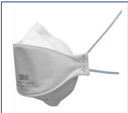
3M™ Aura™ 9320+ Mascarilla autofiltrante plegada para partículas FFP2 sin válvula