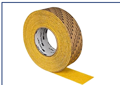
3M™ SAFETY WALK Antideslizantes de alta agresividad Amarillo PVP: 18m x 50mm: 98,84 € / UN