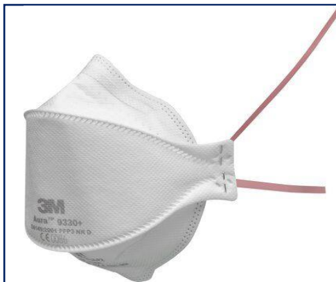
3M™ Aura™ 9330+ Mascarilla autofiltrante plegable para partículas FFP3 sin válvula