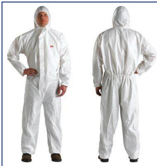
3M™ Prenda de protección 4510 TALLAS: M/L/XL/XXL/XXXL/XXXXL