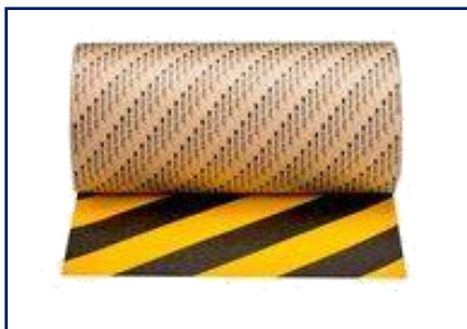
3M™ SAFETY WALK Antideslizantes de alta agresividad Amarillo/ Negro PVP: 18m x 50mm: 70,77 € / UN

Las cintas de marcaje permiten señalar las zonas y distancia de seguridad entre empleados o visitas