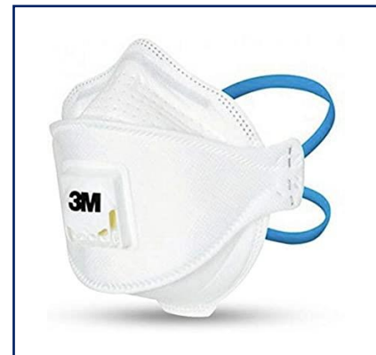
3M™ Aura™ 9322+ Mascarilla autofiltrante plegada para partículas FFP2 con válvula