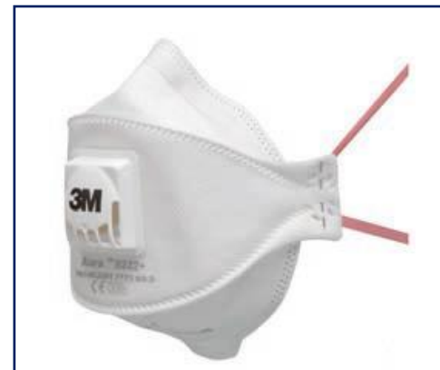
3M™ Aura™ 9332+ Mascarilla autofiltrante plegable para partículas FFP3 con válvula