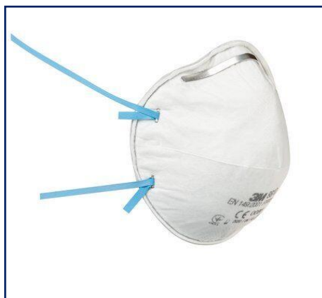
3M™ 8810 Mascarilla desechable autofiltrante moldeada para partículas FFP2 sin válvula

Las mascarillas FFP2 son las recomendadas por la OMS y certificadas para el mercado europeo.