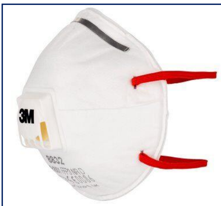
3M™ 8832E Mascarilla autofiltrante moldeada de partículas FFP3 con válvula

Las mascarillas FFP3 son las recomendadas por la OMS y certificadas para el mercado europeo para exposiciones altas y de gran concentración de virus