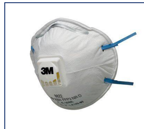
3M™ 8822 Mascarilla autofiltrante moldeada de partículas FFP2 con válvula